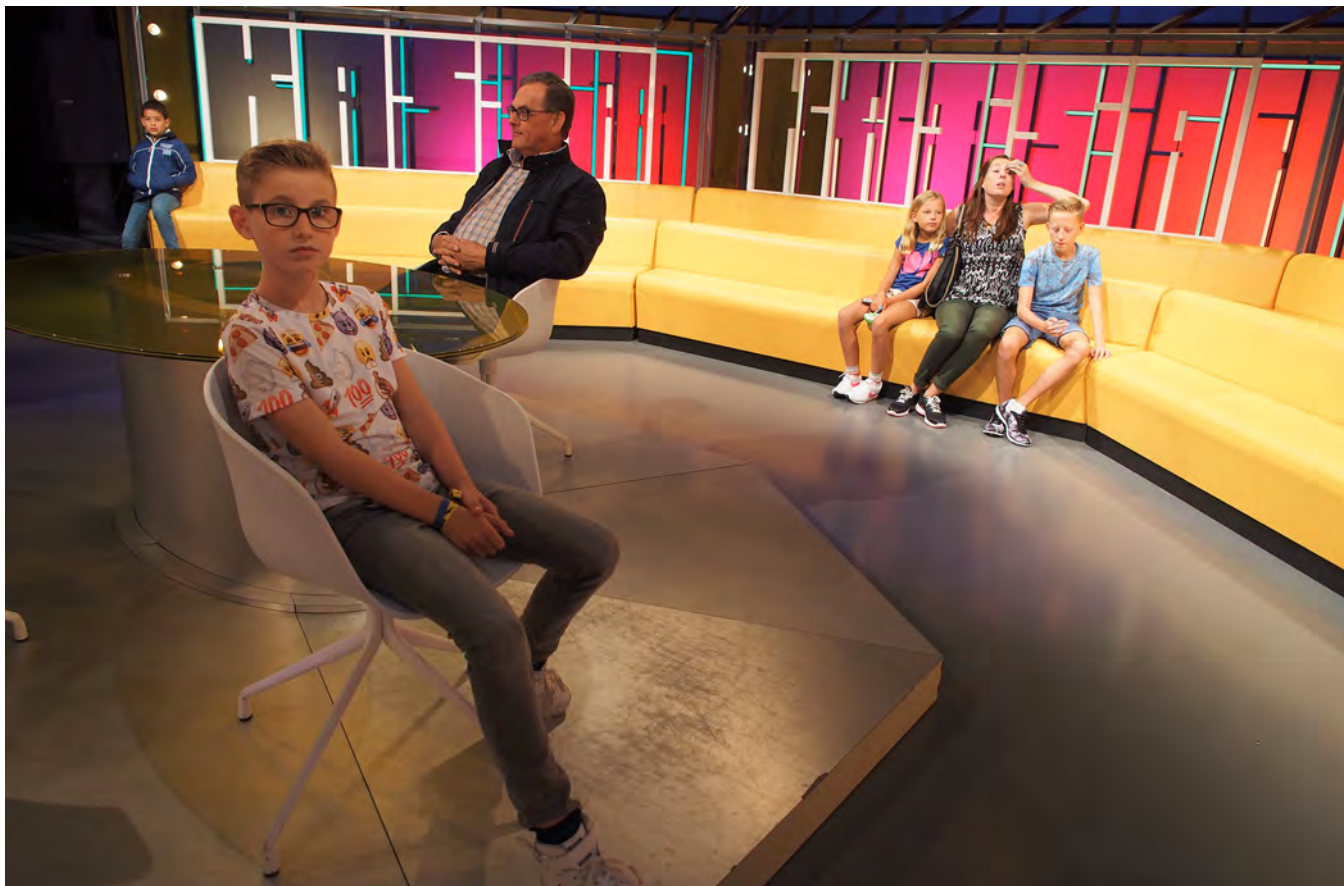
Bezoekers van de Open Studiodagen

Het museum van Beeld en Geluid is aan het einde van de technische en inhoudelijke levensduur. Hoewel de waardering van de bezoekers rond een 8 blijft, zien we wel dat er meer scores zijn van 6 en lager. De bezoekersaantallen lagen eind 2017 iets boven het gemiddeld niveau (sinds de opening eind 2006) en daarmee rond het begrote aantal. De opbrengsten in 2017 liggen echter lager dan begroot en daarmee bestaat de verwachting dat in 2018 eenzelfde situatie zich voordoet. Dit komt onder meer omdat het aandeel niet-betalende bezoekers de laatste jaren toeneemt. Dit zijn bezoeken aan bijvoorbeeld de Open Studiodagen en gedeeltelijk ook tijdens de Top 2000. Er zijn adequate maatregelen genomen om een tegenvaller op de museuminkomsten in 2018 op te kunnen vangen. De ontwikkeling van bezoekerscijfers en waardering wordt gemonitord en indien nodig zal extra inzet worden gepleegd om binnen de doelstellingen te blijven. Extra inzet richt zich op het behoud van de bezoekersaantallen van ruim 200.000 per jaar met een gemiddelde waardering van 7,8 en kan binnen de bestaande begroting en bezetting worden gevonden.