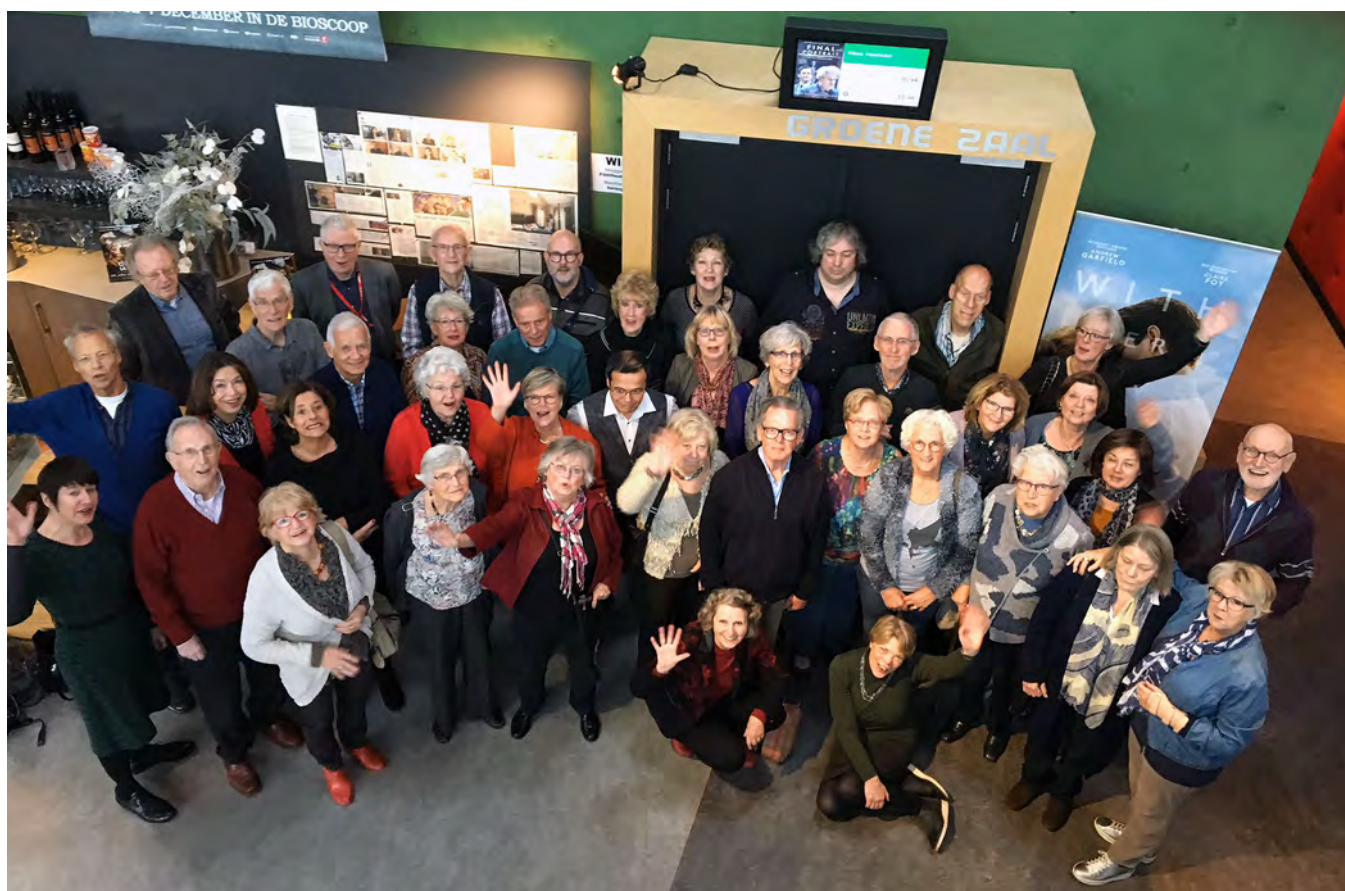
Onze vrijwilligers tijdens de vrijwilligersdag