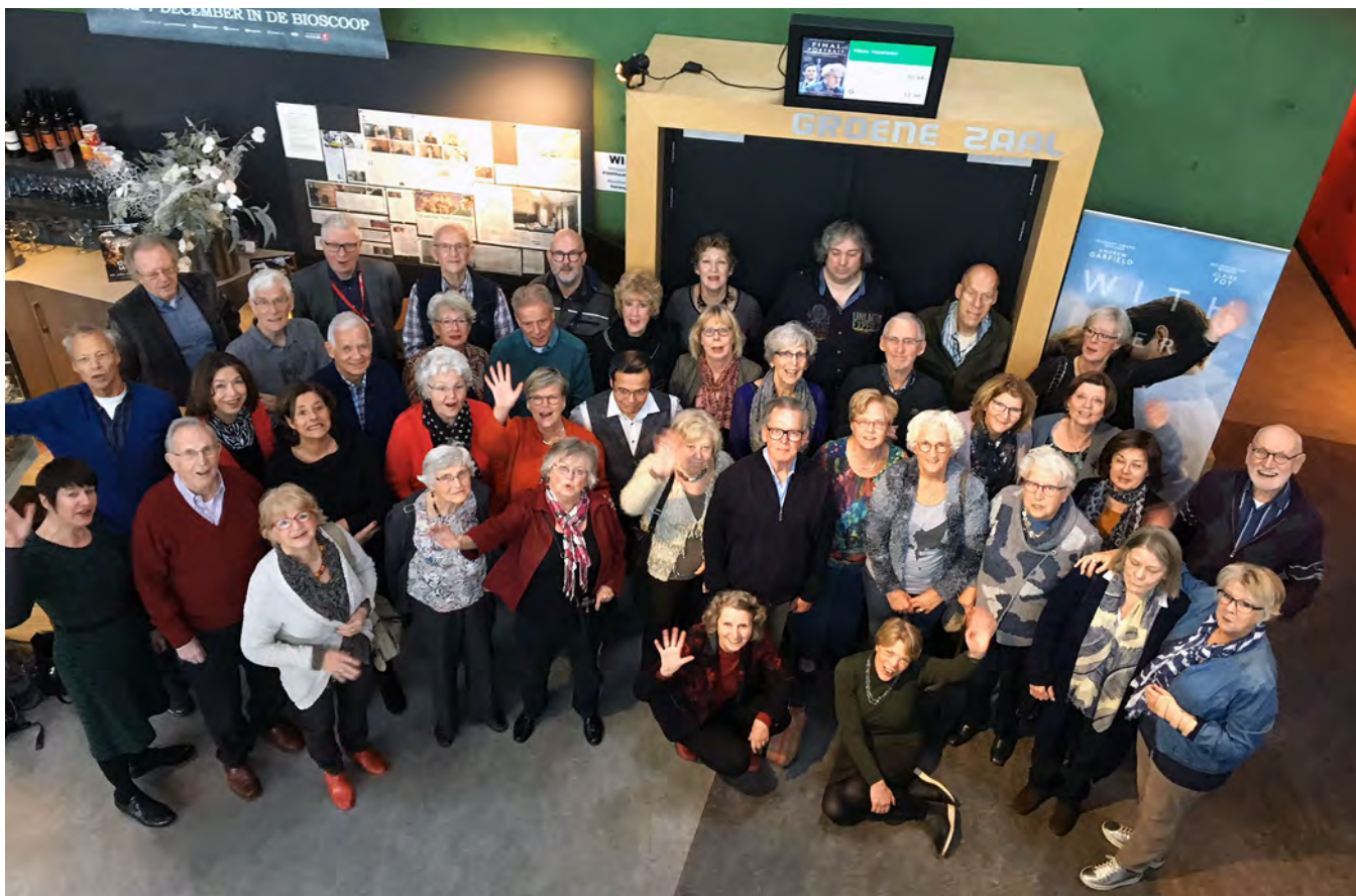
Onze vrijwilligers tijdens de vrijwilligersdag