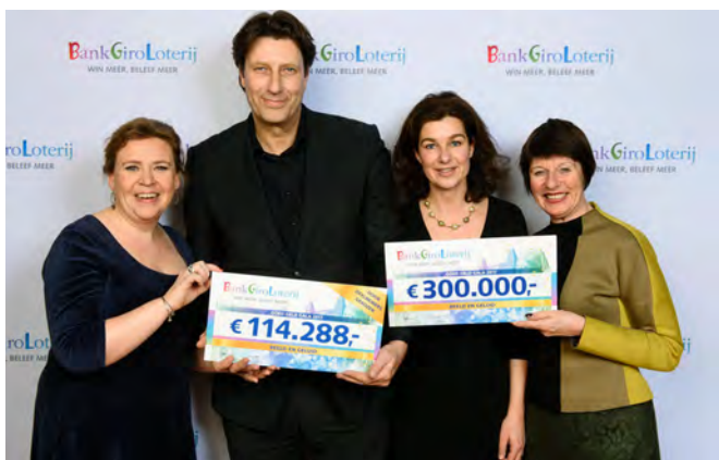
De BankGiro Loterij is hoofdsponsor van Beeld en Geluid

van driehonderduizend euro en een variabel bedrag dat door de deelnemers van de BankGiro Loterij geormerkt is voor Beeld en Geluid. In 2017 ontving Beeld en Geluid € 169.531 aan inkomsten uit dit geormerkt spelen in het loterij-jaar 2017 en € 47.132 uit opbrengsten entree met VIP kaarten. Samsung ondersteunde de tentoonstelling Let's YouTube in 2016 en 2017, en continueerde in 2017 deze projectsteun aan de tentoonstelling Nieuws of Nonsens. Deze projectsteun vertaalde zich in een beschikbaarstelling van de hardware voor de tentoonstelling ter waarde van € 23.679 waaronder een schenking ter waarde van € 6.300.